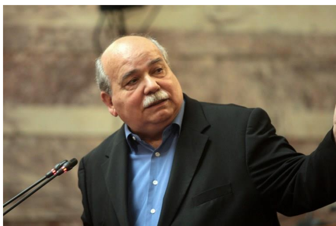
Ο πρόεδρος της Βουλής, Νίκος Βούτσης

Την παρουσίαση της Λευκής Βίβλου σημειώνεται πως πραγματοποίησε ο Γιώργος Κολυβάς.