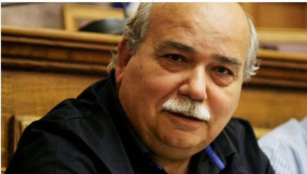
Νίκος Βούτσης, πρόεδρος της Βουλής