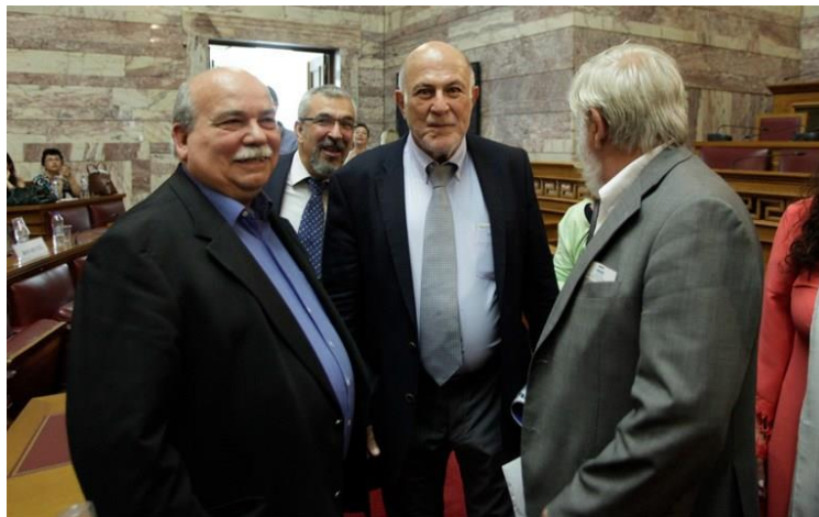
Στιγμιότυπο από την ημερίδα για την Λευκή Βίβλο

Την Παρασκευή 2 Ιουνίου στην αίθουσα της Γερουσία της Βουλής η Ευρωπαϊκή Οικονομική και Κοινωνική Επιτροπή (ΕΟΚΕ) σε συνεργασία με την ελληνική Οικονομική και Κοινωνική Επιτροπή (ΟΚΕ) διοργάνωσε συζήτηση για να ακούσει τις θέσεις της ελληνικής κοινωνίας σχετικά με τα πέντε σενάρια για τη μελλοντική ανάπτυξη της Ευρώπης, όπως αυτά περιγράφονται από τον πρόεδρο της Κομισιόν, Ζαν- Κλοντ- Γιούνκερ, στη Λευκή Βίβλο για το Μέλλον της Ευρώπης της Ευρωπαϊκής Επιτροπής.