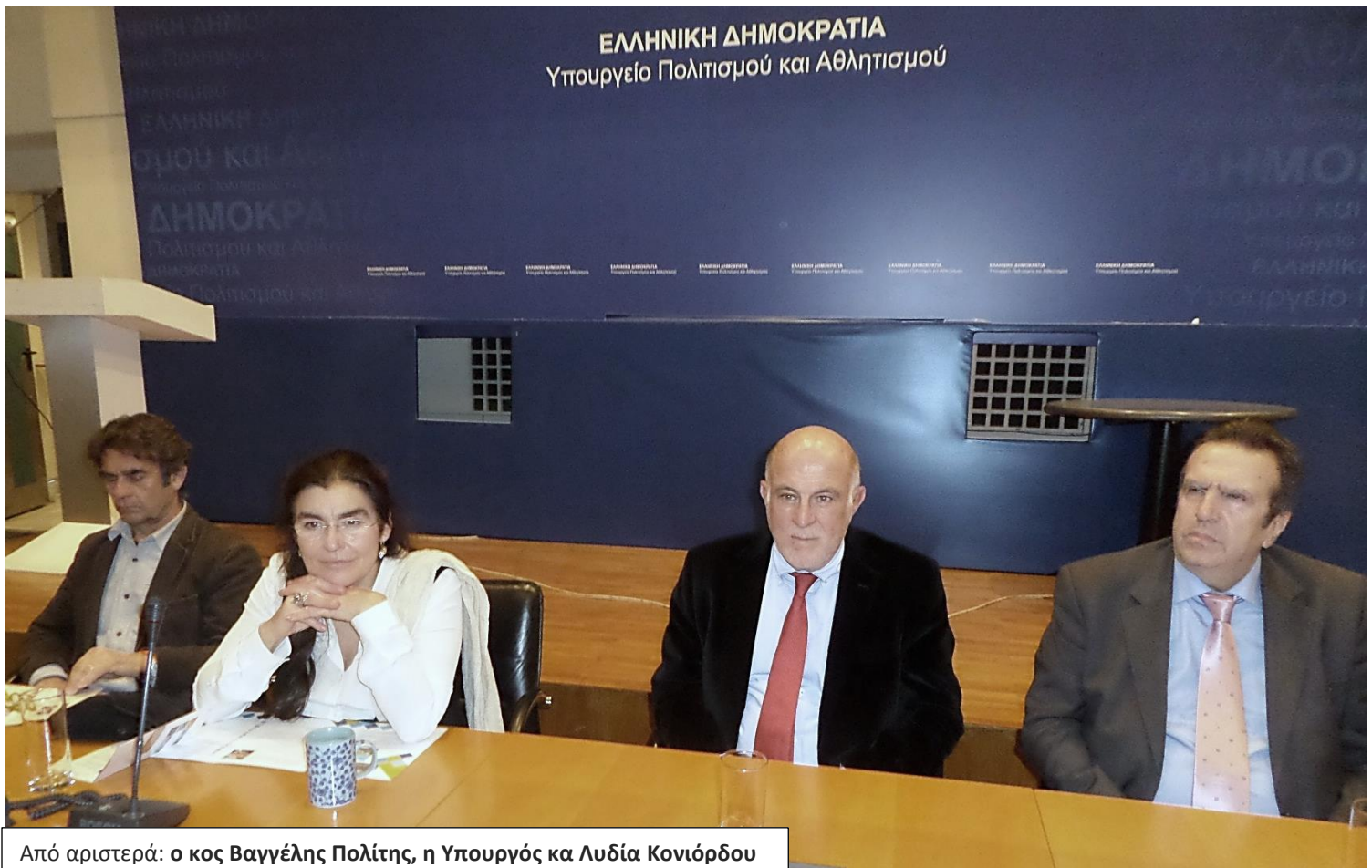
Από αριστερά: ο κος Βαγγέλης Πολίτης, η Υπουργός κα Λυδία Κονιόρδου

Σημειώνεται ότι ακολούθησε επίσκεψη της κινέζικης αντιπροσωπείας στην Εθνική Βιβλιοθήκη, το Ίδρυμα Νιάρχου και το Μουσείο Ακρόπολης, με κατάληξη στο Υπουργείο Πολιτισμού και Αθλητισμού όπου συναντήθηκε με την Υπουργό κα Λυδία Κονιόρδου.